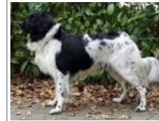
SIEBE VD NESSE OLDEKERKE, NHSB 2237038, ZWART EN WIT, 09-02-1999, 5.08%