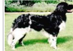
CHESTER MADADH V.H. ZANDHIEM NHSB 2074960 ZWART EN WIT, 09-06-1996, 0.00%