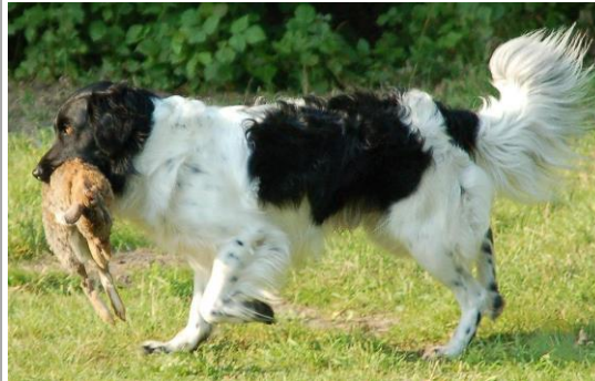
KAIN FENNE V.H. ZANDHIEM, NHSB 2504258, 21-04-2004, 5.76%