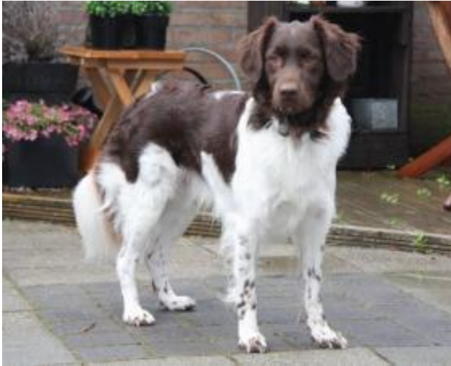
Niels Chester V.H. Zandheim NHSB 2660835