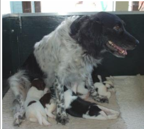
GISILLA PIPPA V.H. ZANDHIEM, NHSB 2281765, ZWART EN WIT, 21-02-2000, 3.71%